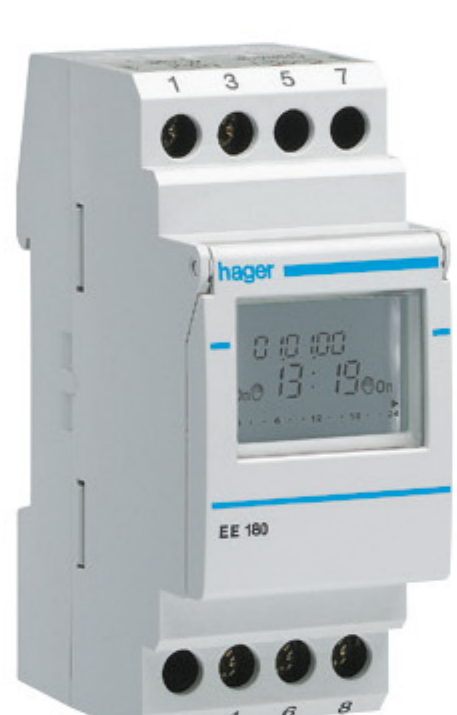
Programador digital astronómico