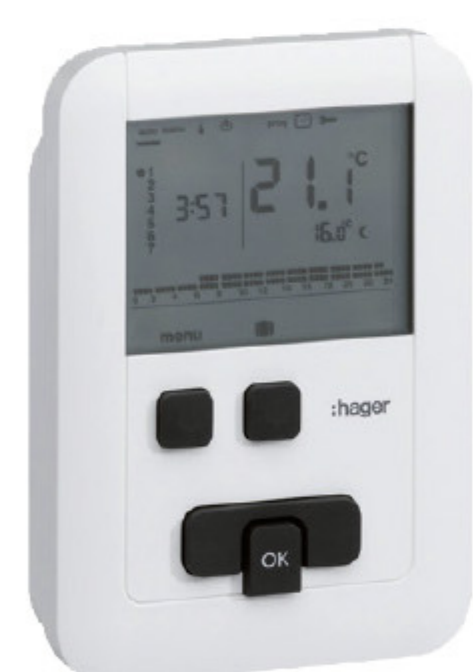
Termostato de ambiente programable