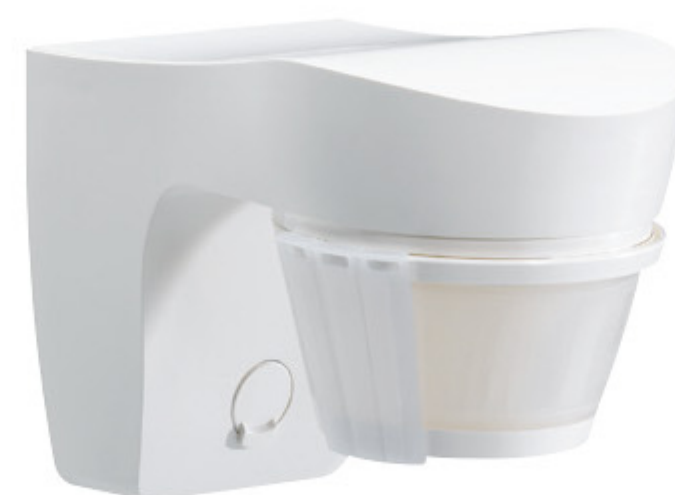
Detector movimiento infrarrojos 140°