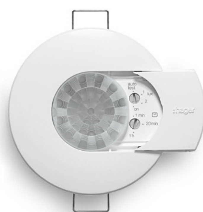
Detector de presencia infrarrojos 360°