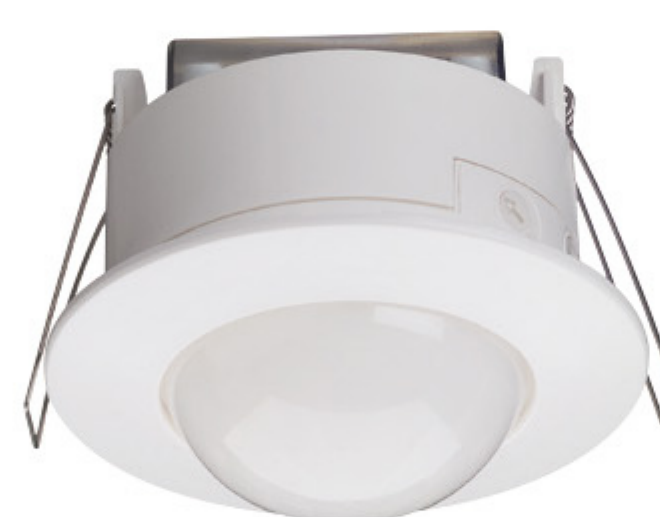
Detector movimiento infrarrojos 360°