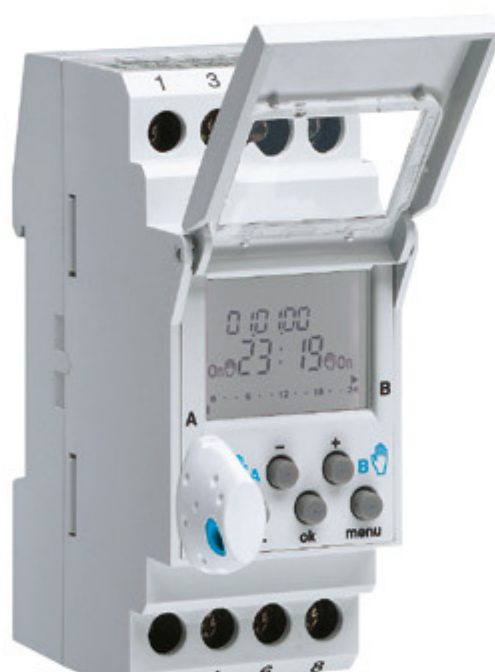
Programador digital semanal